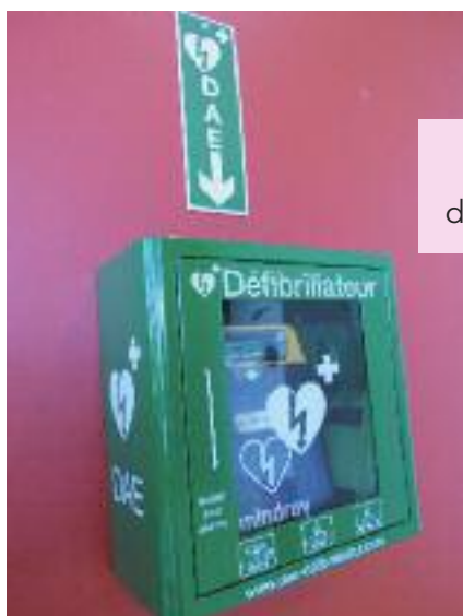
Installation d'un deuxième défibrillateur à la salle Jean Bourdette.