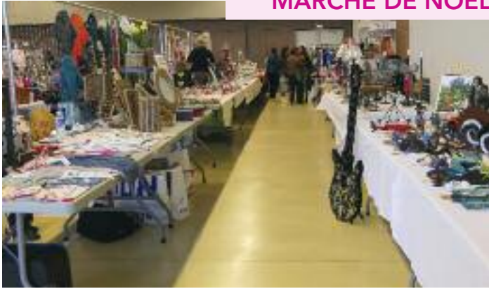
MARCHÉ DE NOËL : 6 NOVEMBRE 2022