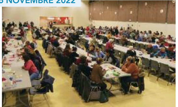
EXPOSITION/VENTE LES FILOUTES : 27 NOVEMBRE 2022